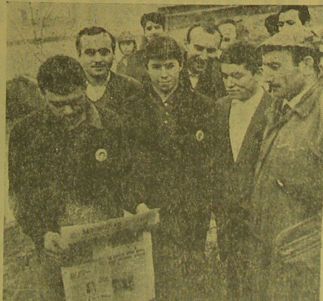
MADEN - İŞ ELDE: Kavel Kablo Fabrikasında çalışan haklarına müdahale edenler işçiler, üyesi oldukları Maden-İş Sendikasının gazetesini okuyarak valedi geçirmeyi daha yararlı bulmuşlardır. Maden - İş elde, gündüze ve dilde.