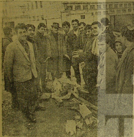
İSİNMAK DA LÂZİM: İşten çıkarılan işçiler fabrika önünde beklerken havanın soğukluğunu da yemeye çalışmışlar ve topladıkları çalıları, tahta parçalarını yakarak ısınmaya çalışmışlardır. Hak uğruna her eziyete göğüs geren şerefli Türk Milletine mensub olmanın sevinçli içindeler.

"Bundan böyle nereden ve hangi kuvvetten gelirse gelsin kanları pahasına da olsa insan haklarını garanti altına alan Anayasa ilkelerinden asla vazgeçmeyeceklerine, fâviz vermeyeceklerine şeref ve namusları üzerine and içtiklerini emekçi kardeşlerine bildirmeyi kararlaştırdık"