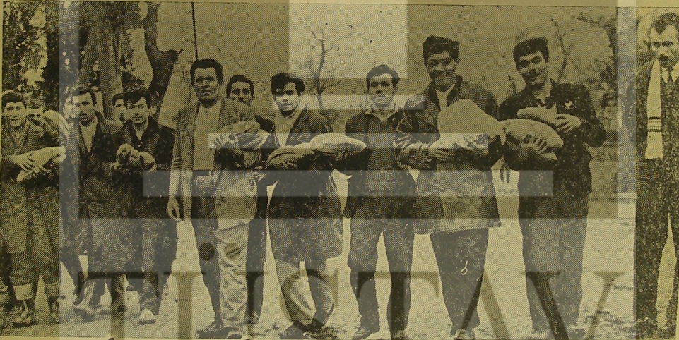
SENDİKA OLUNCA: Kavel Fabrikasında çalışan işçiler işten atıldıktan sonra beş parasız sokakta bırakılmıştır. Fakat sendika, üyelerini yalnız bırakmamış, onlara maddeten ve manen destek olmuştur. Her gün işçilerin yiyecek ihtiyaçlarının karşılanması. Resimde sendikamız dağıttığı ekmekleri sevinçle karşılayan azimli işçilerden bir grup görülmüştür.

Öte yandan Kavel işçilerinin hak arama hareketleri basın yolu ile Türkiye'nin her tarafında duyulunca Maden — İş şehir içi, şehirlerarası telefonlarla ve telgraflarla desteklenmiştir. Manevi destek yanında sendikalar, sosyal adalete gönül veren şahıslar da desteklenmektedir.