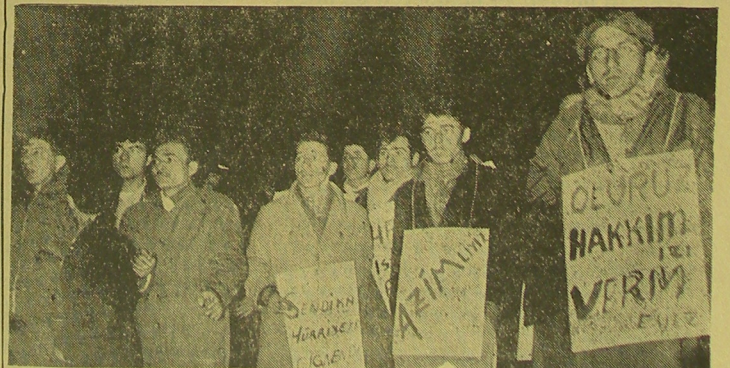
OLURUZ DİYENLER: Haklarının geri alınması üzerine işçiler kanuni haklarına dayanarak bu davranışa protesto etmişlerdir. İşçiler kendi elleri ile kendi kararlarını buldukları kartonlara yazmış ve boyunlarına asmışlardır. İşte kararlı haklarının savunucusu işçiler. Ne diyorlar? "Ölürüz, hakkımızı vermiyoruz."

Etibank'ın işletmekte olduğu 3 köprü maden ocağında verimi arttırmak için işçiler gerekli emniyet tahkimatı yapmaktan alıkonulmuş ve sorumlu teknik elemanlar işçi hayatını hiçe sayarak çalışanları bile ölüme